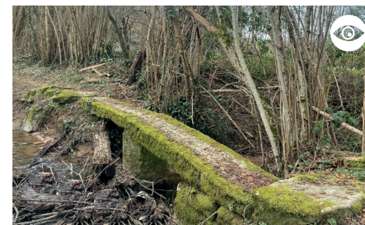
PONT EN PIERRE DU TARON