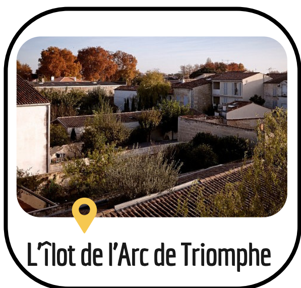
L'Îlot de l'Arc de Triomphe

dans la ville de Saintes de 16H30 à 18H30