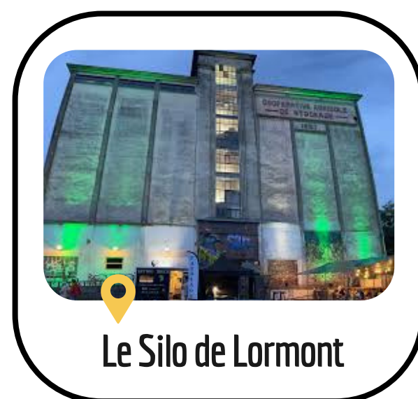
Le Silo de Lormont