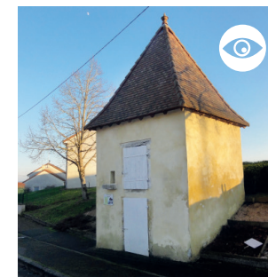
LE FOUR À PAIN