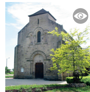
L'ÉGLISE ET SA CLOCHE