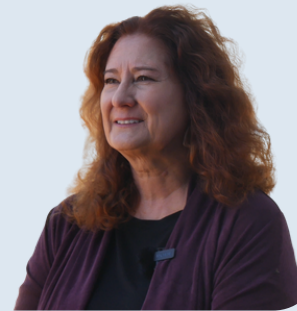
Linda Kohanov Créatrice d'Eponaquest (des centaines d'équicoachs formés à l'international)