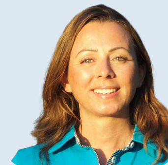
Léa Lansade Ethologue reconnue spécialisée dans la recherche du comportement équin