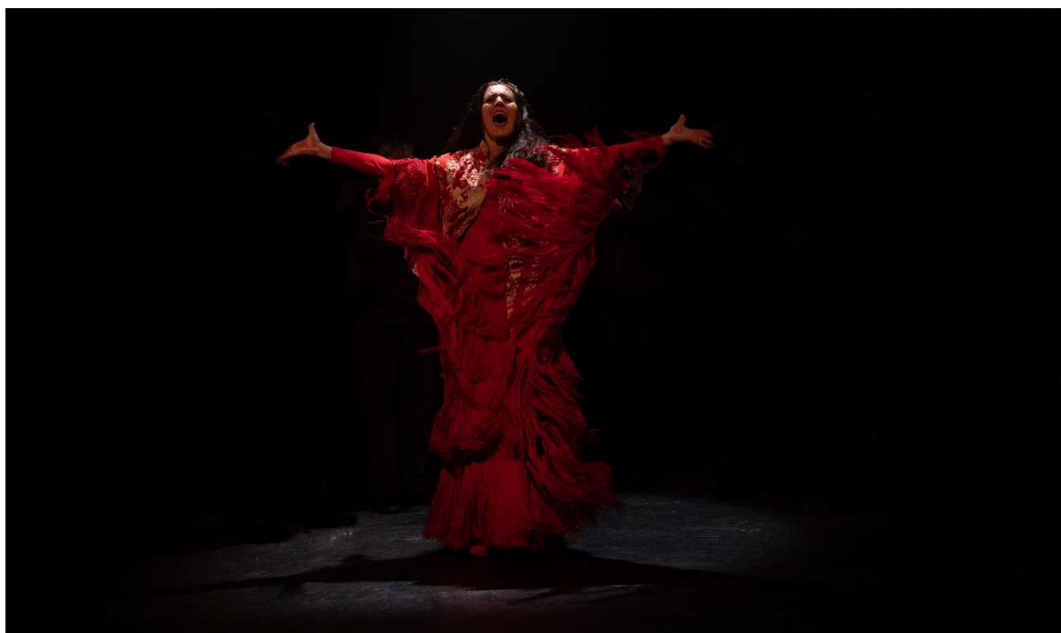
Lori La Armenia sera sur la scène du village le dernier soir du Festival

Samedi 4 juillet - Pour clore la 37 e édition, la bailaora Lori la Armenia présentera sa création Tanza , accompagnée sur scène de Cristo Cortés, Ismael de Begoña et Miguel Lavi. Enfin, jusque tard dans la nuit, une session Electro Duende des DJ Lisa del Cristo, Ibhamuza et L.HKLéon , accompagnés du cantaor Cristo Cortés , transformera la place Charles-de-Gaulle en dance floor , afin de terminer le festival sur une note festive et chaleureuse.