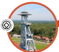
SITE MINIER D'ARENBERG LA PORTE DU HAINAUT WALLERS-ARENBERG