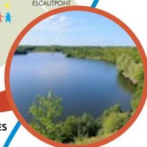
MARE À GORIAUX RAISMES