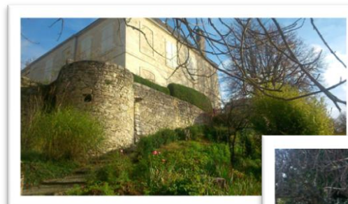
2 Le château