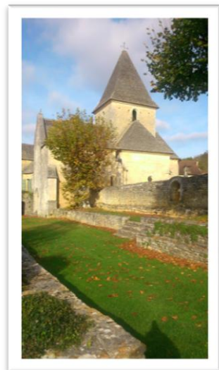
1 Eglise du 14e