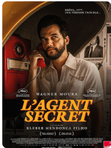
L'AGENT SECRET de Kleber Mendonça Filho / 2h40 / VOSTFR Prix de la mise en scène et Prix d'interprétation masculine au Festival de Cannes 2025

Brésil, 1977. Marcelo, un homme d'une quarantaine d'années fuyant un passé trouble, arrive dans la ville de Recife où le carnaval bat son plein. Il vient retrouver son jeune fils et espère y construire une nouvelle vie. C'est sans compter sur les menaces de mort qui rôdent et planent au-dessus de sa tête... (Avertissement)