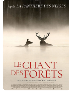
LE CHANT DES FORÊTS de V. Munier / 1h33 Accessible à partir de 8/9 ans