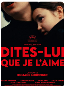
DITES-LUI QUE JE L'AIME de R. Bohringer / 1h32 SÉLECTION OFFICIELLE FESTIVAL DE CANNES 2025

Romane décide d'adapter pour le cinéma le livre de Clémentine Autain consacré à sa mère. Ce projet va l'obliger à se confronter à son passé et à sa propre mère qui l'a abandonnée quand elle avait neuf mois.