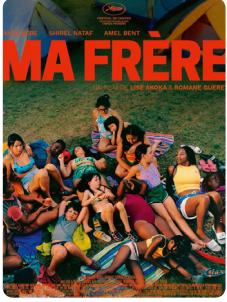
MA FRÈRE de L. Akoka, R. Gueret / 1h52 SÉLECTION OFFICIELLE FESTIVAL DE CANNES 2025

Shaï et Djeneba ont 20 ans et sont amies depuis l'enfance. Cet été-là, elles sont animatrices dans une colonie de vacances. Elles accompagnent dans la Drôme une bande d'enfants qui, comme elles, ont grandi entre les tours de la Place des Fêtes à Paris. À l'aube de l'âge adulte, elles devront faire des choix pour dessiner leur avenir et réinventer leur amitié.