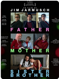
FATHER MOTHER SISTER BROTHER de J. Jarmush / 1h51 / VOSTFR LION D'OR FESTIVAL DE VENISE 2025

Father Mother Sister Brother est un long-métrage de fiction en forme de triptyque. Trois histoires qui parlent des relations entre des enfants adultes et leur(s) parent(s) quelque peu distant(s), et aussi des relations entre eux.