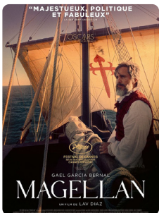
MAGELLAN de L. Diaz / 2h43 / VOSTFR SÉLECTION OFFICIELLE FESTIVAL DE CANNES 2025

Porté par le rêve de franchir les limites du monde, Magellan défie les rois et les océans. Au bout de son voyage, c'est sa propre démesure qu'il découvre et le prix de la conquête. Derrière le mythe, c'est la vérité de son voyage. (Avertissement)