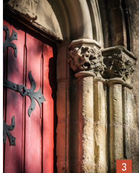
1. Dimanche de Caractère® à Mussy-sur-Seine / 2. Cave aux Riceys / 3. Porte de la collégiale de Hombourg-Haut