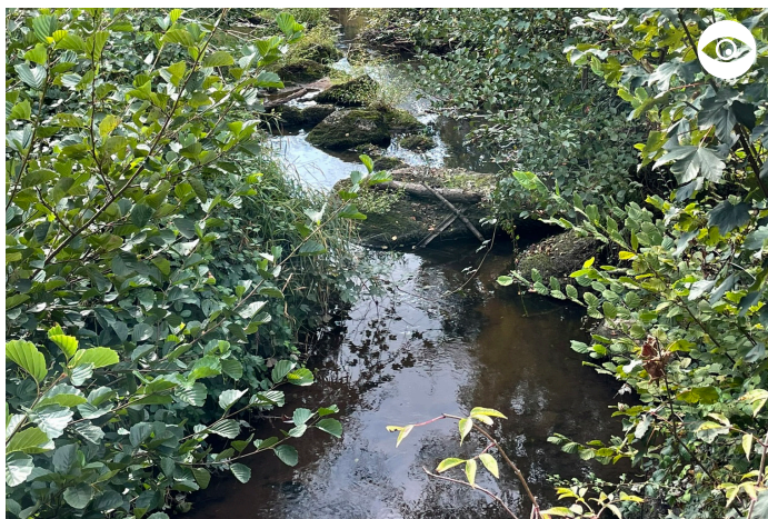
RUISSEAU LA LIMACE