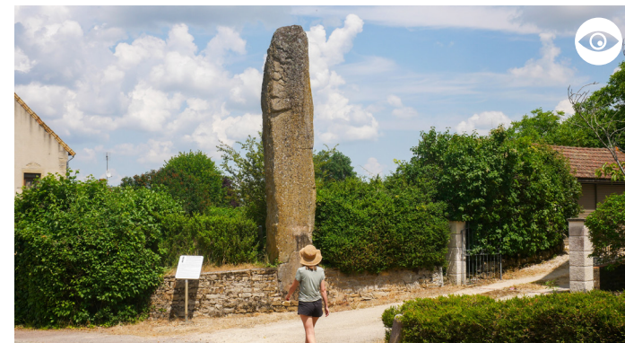
MENHIR DE LA PIERRE AUX FÉES