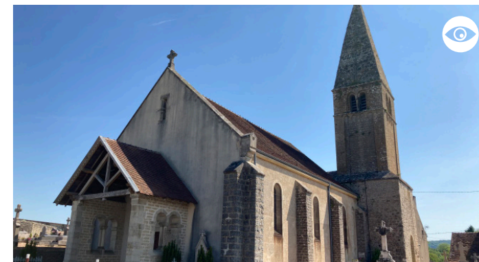
ÉGLISE SAINT-PIERRE (HORS PARCOURS)