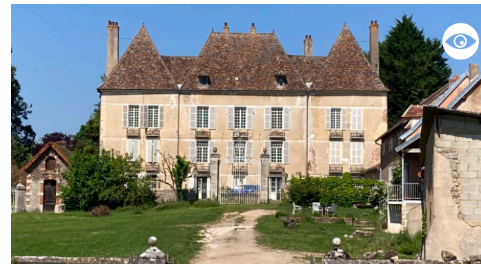
CHÂTEAU DE SAINT-MICAUD (PRIVÉ)