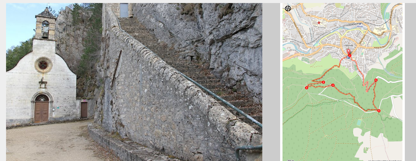
Ermitage de Saint-Privat

Cette boucle vous conduira jusqu'à l'un des points culminants du Causse de Mende : Le Mont-Mimat (1070 m). Vous passerez par l'ermitage et la chapelle de Saint-Privat via un chemin de croix. C'est, selon la tradition, dans la grotte qui se trouve en cet endroit, que Privat, évangéliste chrétien, aurait été martyrisé par les Alamans. Vous découvrirez aussi de magnifiques panoramas sur la cité mendoise, la vallée du Lot et la Margeride qui s'étend au nord de Mende.