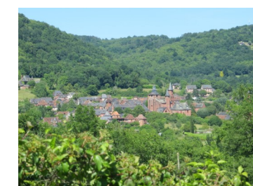
Vue sur Collonges-la-Rouge