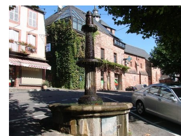
Place du Ceyran

Prendre à gauche et rejoindre la place du Céran.