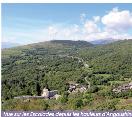
Vue sur les Escalades depuis les hauteurs d'Angoustrine

Au sentier, prendre à droite le GRP Tour de Cerdagne qui mène au cimetière et à l'église d'Angoustrine. Suivre ensuite la carrer del Sabater puis la carrer de les Orenetes qui mène à la place principale du village. Pour le retour, suivre le même itinéraire.