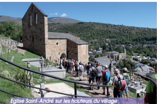
Eglise Saint-André sur les hauteurs du village

Le village d'Angoustrine-Villeneuve-des-Escaldes a la particularité d'accueillir quatre églises. Une à Villeneuve des Escalade, une dans le centre d'Angoustrine, la plus récente, une romane sur les hauteurs du village et une plus excentrée, sur le chemin qui mène aux Bouillouses. A l'exception de l'église du centre du village, de style néo-gothique, les autres églises datent du XII ème siècle et sont de fabuleux témoignages de l'art roman en Cerdagne. En effet, les retables remarquables valent le coup d'œil.