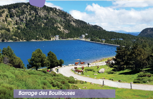
Barrage des Bouillouses