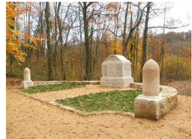
Fontaine des Mineurs bavarois – 1915

Curiosités: fontaines et sources, menhir, point de vue et chapelle.