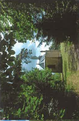
wp04 > la Chapelle des bures