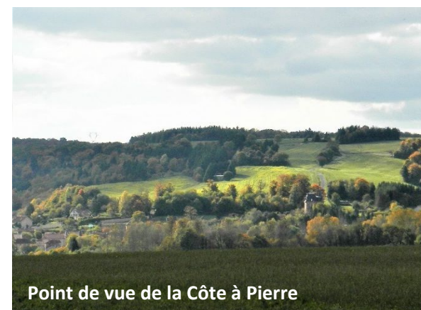
Point de vue de la Côte à Pierre

Caractéristiques: parcours sans difficulté particulière, varié entre plaine et collines. Un tiers est ombragé en forêt. Curiosités: points de vue, églises, église Saint Evre à Mécrin avec les fresques de sa nef peintes en 1937 par Dante Donzelli, patrimoine de Ligier Richier, calvaires et vestiges divers