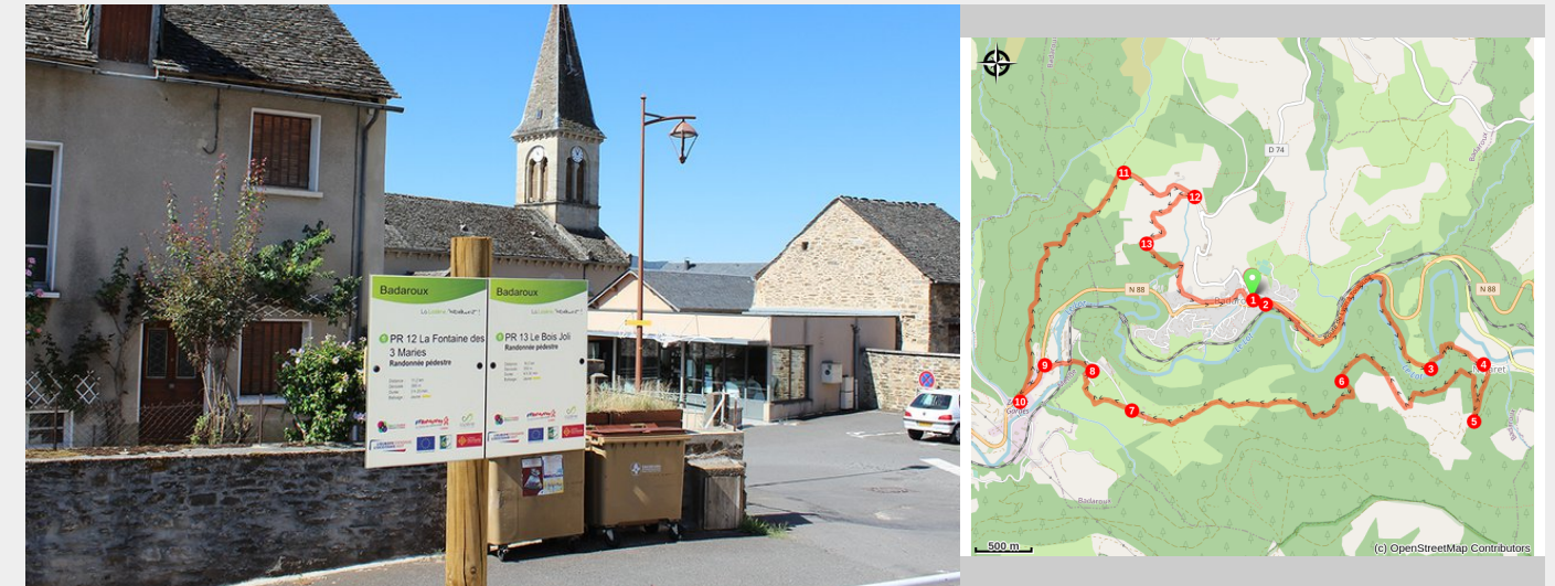
Départ de sentiers à Badaroux (48) (FS - OTI Mende)

Cet itinéraire au départ de Badaroux suit les méandres du Lot sur ces deux rives. Il traverse le hameau de Nojaret, lieu de naissance de Jean-Antoine Chaptal, né en 1756, grand chimiste et industriel ainsi qu'homme politique de premier plan au XVIII et XIXème siècle, qui mit notamment au point la "chaptalisation" des vins (procédé permettant d'améliorer les vins médiocres de l'époque).