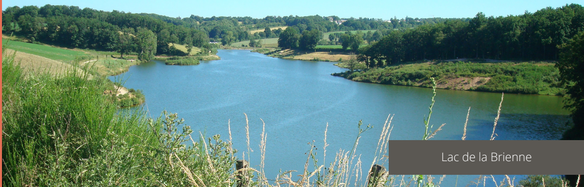
Lac de la Brienne