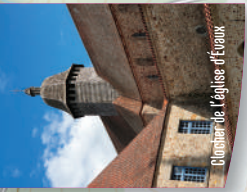
Clocher de l'église d'Évaux