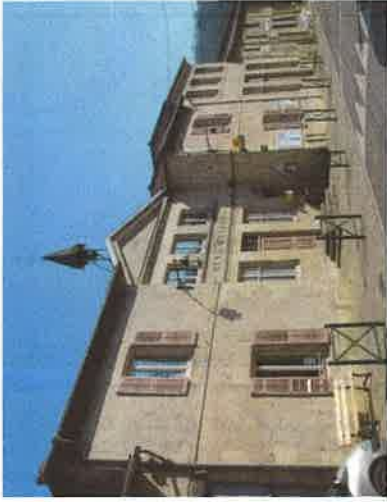
La Mairie et en face la fontaine