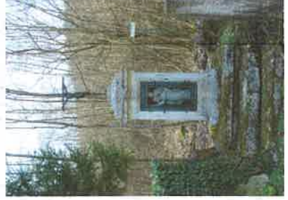
St Vincent ...patron des Vignerons