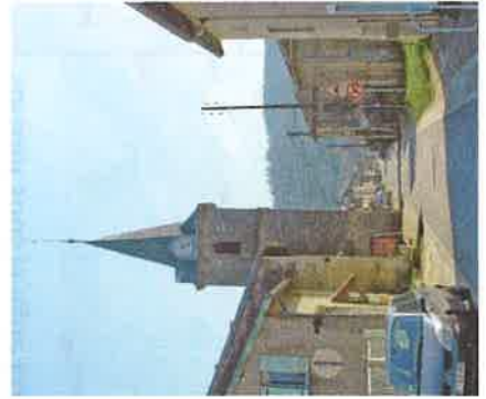
L'Eglise St Maurice