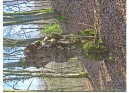
L'Art en forêt