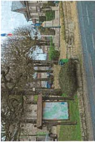
Panneau R.I.S. > à côté du Poilu (Relai Information Service)