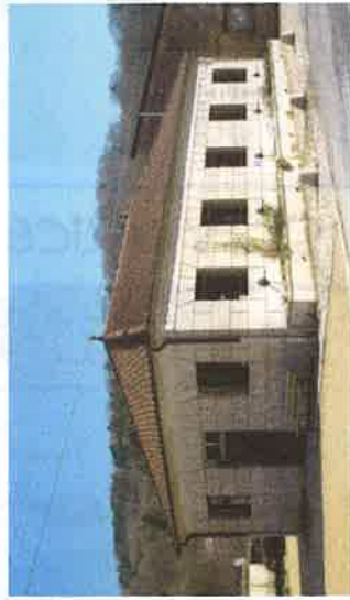
Le lavoir/abreuvoir de 1848 et son musée des Sapeurs Pompiers