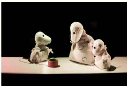
La petite Casserole d'Anatole

Le Pays de Loiron encourage la découverte cinématographique en partenariat avec Atmosphères 53. Les élèves des écoles maternelles et primaires du territoire bénéficient tous les ans du dispositif Ciné-Enfants et visionnent des films au cinéma Le Trianon du Bourgneuf-la-Forêt (plus de 3000 entrées).