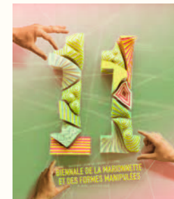
© Jérôme Corgier - Atelier Pariri

Treize structures culturelles réparties sur la Mayenne, le Maine-et-Loire et la Sarthe s'associent et proposent, du 8 janvier au 23 février 2018, une programmation autour de la marionnette et des formes manipulées : créations / spectacles / expositions / stages.