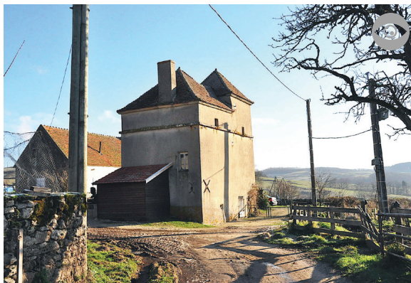
TOUR COLOMBIER DE CHAVANNES