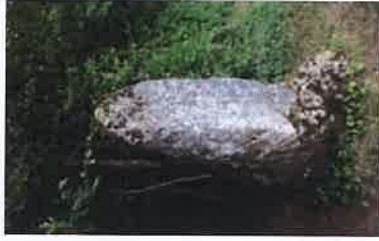
Pierre de la Damechonne

Origine celtique supposée : 1800 ans avant J.C.. C'est une pierre compacte dressée, avec une forme humaine. Son nom est synonyme de "Belle Dame" (schön). On dit que les femmes stériles s'asseyaient sur son pied pour retrouver la fécondité. Les Allemands ont gravé leur formule "Gott mit uns (Dieu avec nous)" dans la pierre.