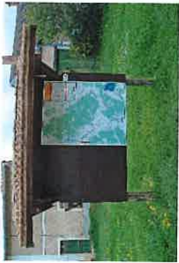
Panneau R.I.S. de départ