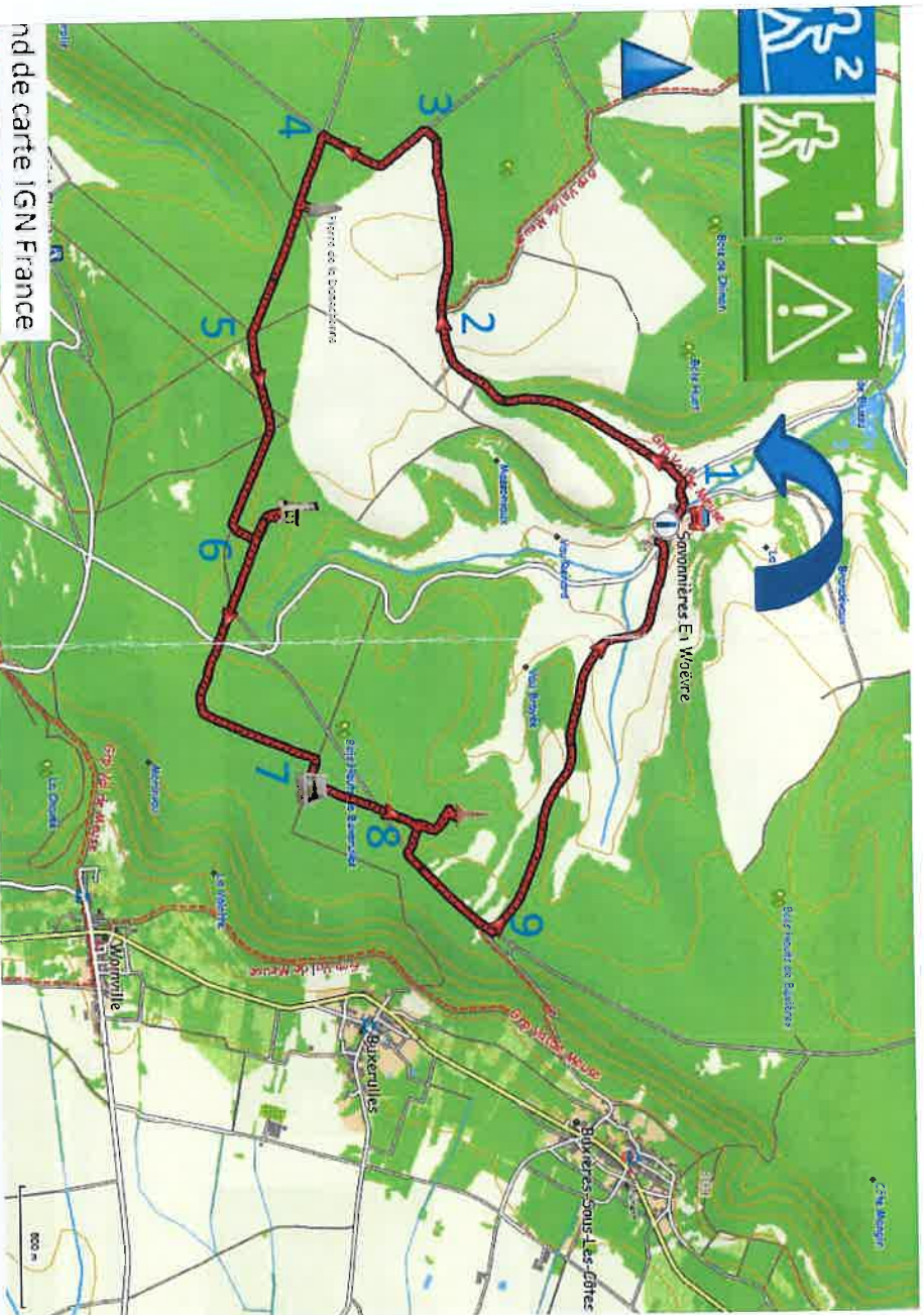
Extrait de carte IGN France