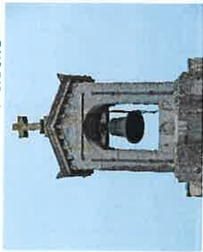
Histoire de la Cloche