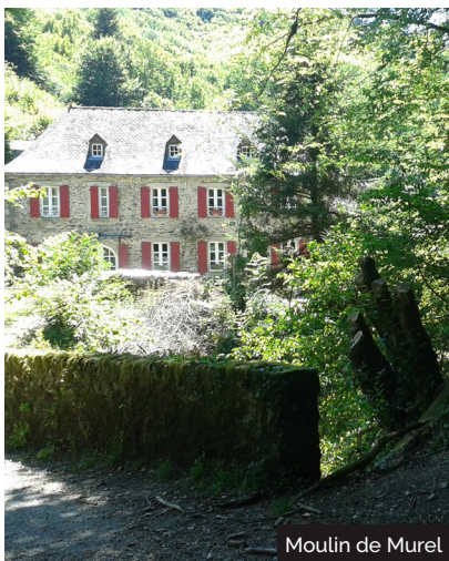
Moulin de Murel