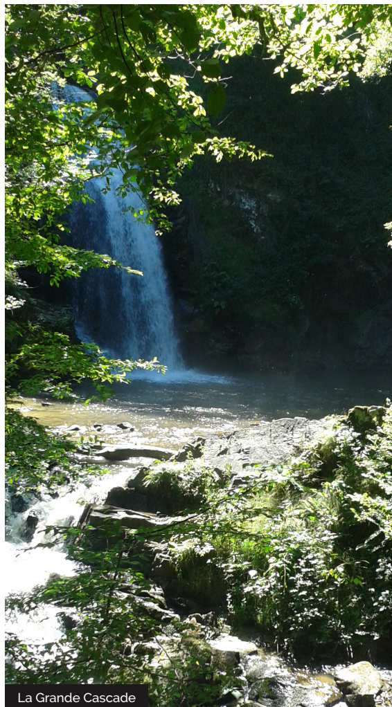
La Grande Cascade

Ce site naturel classé et préservé est occupé par un écosystème propre aux caractéristiques du lieu, une sensibilisation est donc en place sur la faune et la flore, veuillez respecter ces lieux et prendre soin de ce coin de nature magnifique et ressourçant.