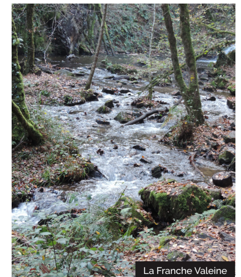
La Franche Valeine

Refaire le même trajet, en sens inverse, en suivant scrupuleusement le balisage jaune n°11. ( belles perspectives sur la forêt et la rivière ),