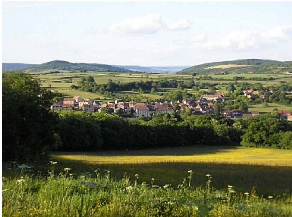
Office de tourisme du Grand Chalon

prendre à gauche en direction de la « Fontaine du Longe ». Panoramas sur Aluze, Chalon et la vallée de la Saône mais aussi sur les monts du Jura et le Mont Blanc, par temps clair. Descendre par la première route à gauche jusqu'au premier chemin à droite, à la « Fontaine du Longe » (3). L'emprunter en direction du lieu-dit « En Bel Air ». Ignorer le chemin qui descend à gauche et continuer tout droit. Au chemin empierré, prendre en face et aller jusqu'à la route et l'aire de pique-nique de la place des noyers (4). A 100 m à droite, hors circuit balisé, depuis la route, panorama sur la vallée de la Dheune, le Couchois et le Mont Rome d'un côté et sur Charresey, Aluze et Chalon de l'autre. Attention aux voitures, chaussée rétrécie. Place des noyers, tourner à gauche sur la route. Au croisement, vers la Croix de Bel Air, traverser la route, tourner à gauche et longer la RD261. Attention en traversant. Au premier virage, descendre par la Grimpette de Cruzille. Lavoir du XIXes. En bas, ignorer la rue qui descend à droite. A 30 m à gauche, sur la petite place, la Fontaine aux Dames. Traverser la place, poursuivre tout droit pour rejoindre la route. Prendre à droite en descendant pour rejoindre l'école et la mairie.