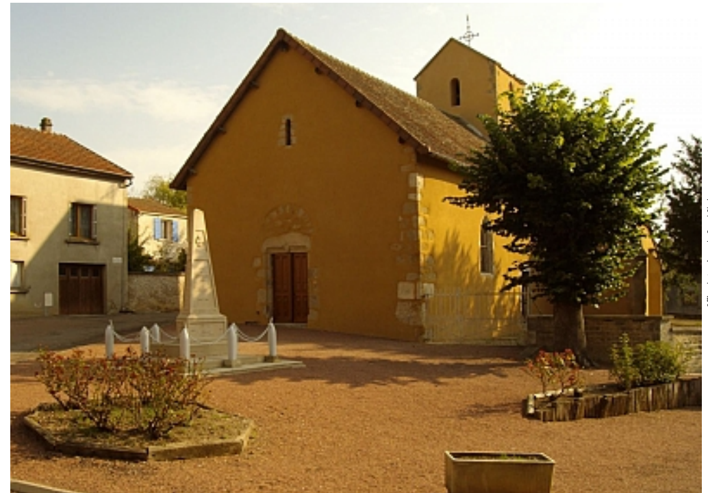
Office de tourisme du Grand Chalons