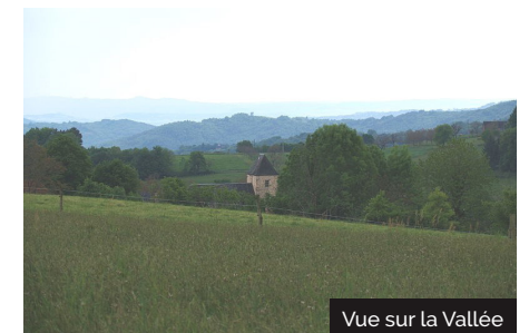
Vue sur la Vallée

11 Dans le village, à l'épingle de la route, prendre à gauche entre une grange et une maison, puis tourner à gauche à l'angle de la grange. Dépasser un bâtiment à droite et descendre tout droit sur le chemin. Après un virage à droite très serré, on rejoint la route de Moulinot.