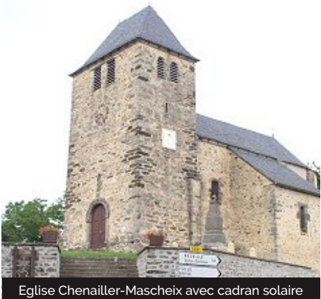
Eglise Chenaillet-Mascheix avec cadran solaire

Ce village est le fruit de la réunion, en 1843, de deux communes issues de la Révolution : Chenaillet et Mascheix, ce qui explique la présence de deux églises. Certains éléments rappellent que Mascheix fut une dépendance de l'Ordre de malte : son cimetière et sa croix maltaise sur socle du XVème siècle. Elle faisait partie de la commanderie de Carlat, en Auvergne. Chenaillet fut l'un des hauts-lieux de la résistance durant la seconde guerre mondiale, on y trouvait un des QG de l'Armée secrète et des camps d'entraînement du maquis.