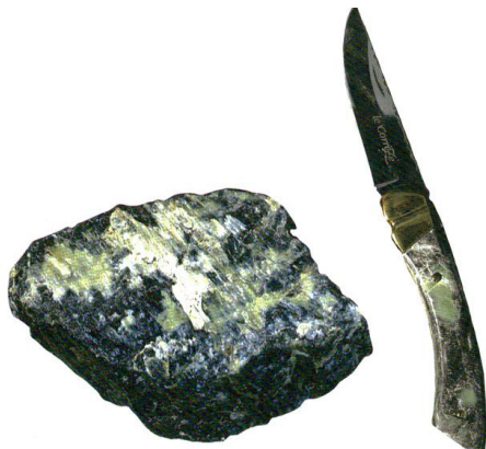
Serpentine : de l'état brute à l'objet artisanal

La pierre serpentine regroupe plus d'une vingtaine de minéraux du groupe des silicates. Ce n'est donc pas un minéral, mais un ensemble. Également appelée ophite ou ophiolite, la pierre serpentine est souvent difficile à identifier, car elle se décline dans de multiples couleurs et de nombreuses variétés : on la rencontre le plus souvent de teinte olive, mais elle existe aussi dans des nuances rouge, vert clair, vert forêt, jaune, noir ou blanc. Le mot serpentine provient de l'aspect le plus répandu de ce minéral, plutôt rugueux et écaillé avec une teinte vert olive qui rappelle la couleur du reptile. En latin, serpentine signifie d'ailleurs serpent de pierre, et son autre appellation, ophite, provient du grec ophidis qui désigne le serpent. La pierre serpentine est utilisée depuis la nuit des temps pour ses vertus décoratives et médicinales.