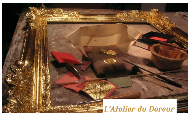
L'Atelier du Doreur