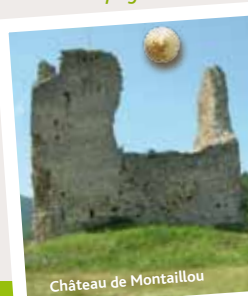
Château de Montailou

De Montségur en Ariège à Berga en Catalogne, ce chemin de Grande Randonnée retrace l'itinéraire des derniers cathares en exil. Fuyant l'inquisition, la prison, la spoliation, voire la mort, ces bonshommes utilisaient cet itinéraire pour aller trouver refuge en Catalogne. Ainsi, empruntant un axe important entre le XI e et le XVI e siècle, le « Chemin des Bonshommes », itinéraire pyrénéen transfrontalier, permet en 8 jours environ, à pied, à cheval ou même en VTT un voyage dans le temps, à la rencontre d'une mosaïque de cultures attachantes et au milieu de paysages remarquables. Le topoguide décrivant cet itinéraire est édité par la Fédération Française de Randonnée et disponible dans de nombreux points de vente.