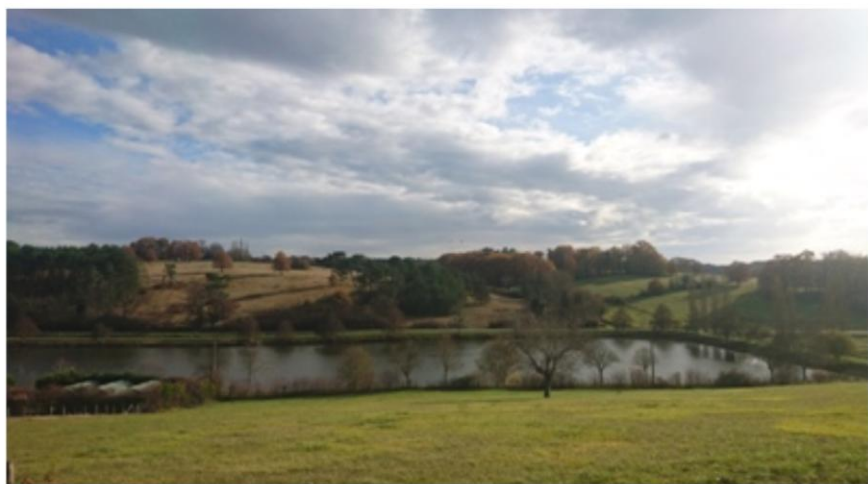
1 L'étang de Fossemagne

Fossemagne a été un lieu de passage et d'occupation depuis fort longtemps. L'église romane Saint-Astier du XIIe a été récemment restaurée. Au XIVE est fondée la Bastide de Bonneval. Le plan d'eau avec son restaurant propose une baignade surveillée avec jeux pour enfants, location de canoës, de pédalos et la pratique de la pêche.