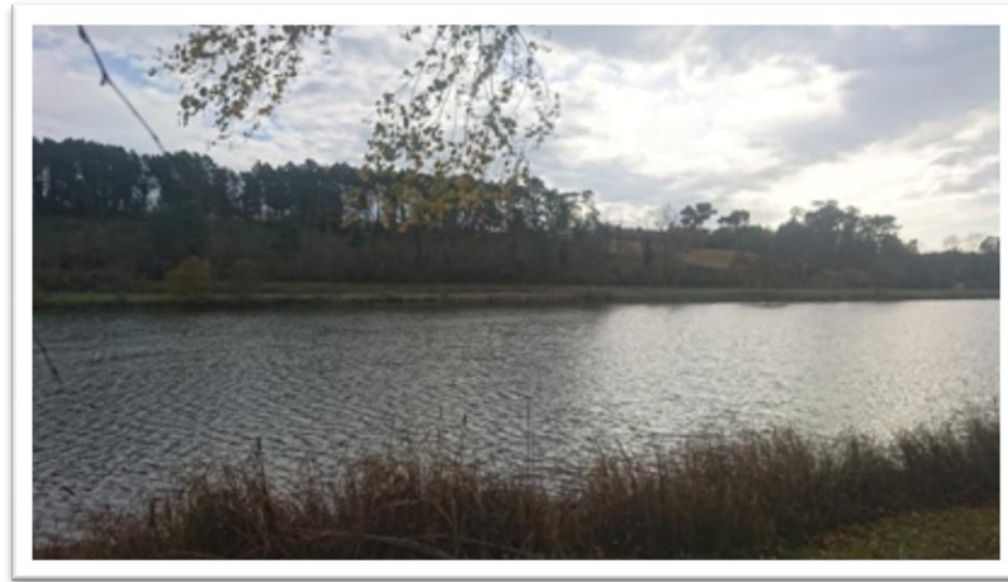
1 Etang de Fossemagne