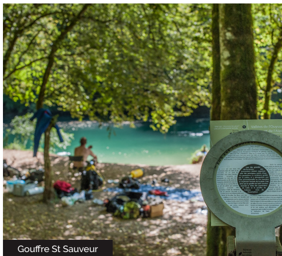
Gouffre St Sauveur

Le gouffre de Cabouy n'est pas une source. Il s'agit de la résurgence de l'Ouyse, rivière issue d'un réseau de ruisseaux en surface situés bien plus à l'est, sur les terrains imperméables du Ségala et du Limargue. Parvenues sur le Causse de Gramat, ses eaux s'enfoncent dans les profondeurs. L'Ouyse souterraine parcourt plus de 20km avant de ressurgir à Cabouy, véritable grotte noyée. Lors de crues, on peut voir ses eaux colorées par les argiles transportées. Au gouffre de St-Sauveur, les eaux, issues du ruissellement de pluies tombées sur un bassin versant du causse, n'ont pas d'argile à éroder et sont à l'inverse claires. Ces deux sites sont de renommée internationale pour la plongée souterraine. Le gouffre de Poumayssen est un petit gouffre enserré de falaises dont les parois d'aspect taillé évoquent l'entrée d'un temple englouti. Nul ruisseau ne s'écoule du gouffre de Poumayssen. L'eau ne fait ici qu'une apparition pour replonger au coeur de la terre.