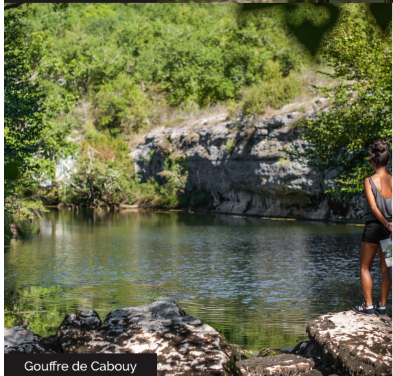
Gouffre de Cabouy

Embarquez vos randonnées en téléchargeant l'appli Vallée de la Dordogne - Tour sur iPhone, l'iPad et l'iPod touch