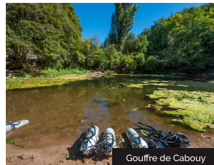
Gouffre de Cabouy

La grotte se compose d'une section presque cylindrique : il s'agit d'un tube phréatique, une conduite forcée. La galerie a été creusée en régime noyé sous-pression, prouvant que le niveau de la nappe karstique était bien plus haut qu'aujourd'hui. Cette cavité est un précieux refuge pour les chauves-souris. Toutes les espèces sont protégées en France, il est important de ne pas les déranger durant leur sommeil, leur réveil leur demandant une grosse consommation d'énergie. Les espèces cavernicoles les plus communes dans le secteur sont le minioptère de Schreibers et les rhinolophes. De retour à l'extérieur, l'arche est dans le prolongement de la grotte et témoigne que le réseau souterrain se prolongeait au-delà.