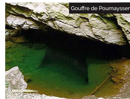
Gouffre de Poumayssen

4 Emprunter le chemin à gauche qui mène au bord d'une immense dépression ( un cloup ). Prendre alors la piste à gauche qui ramène au parking de départ.