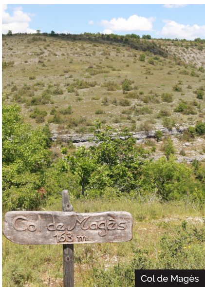
Col de Magès