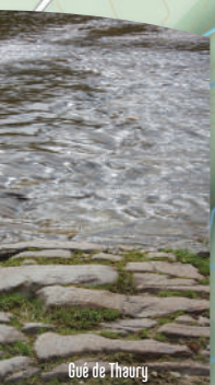
Gue de Thaury