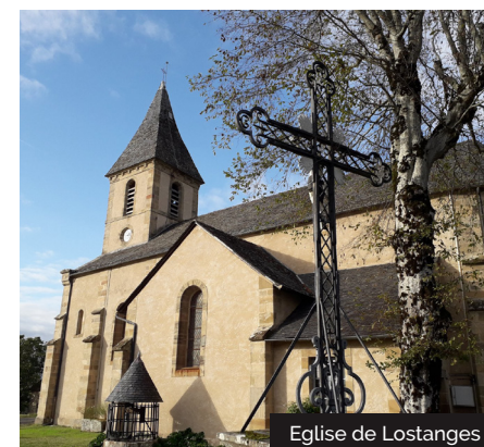
Église de Lostanges

7 Suivre la route à gauche, traverser La Boueyrie. A la jonction de routes, à hauteur d'une croix , continuer tout droit pour revenir à l'église.