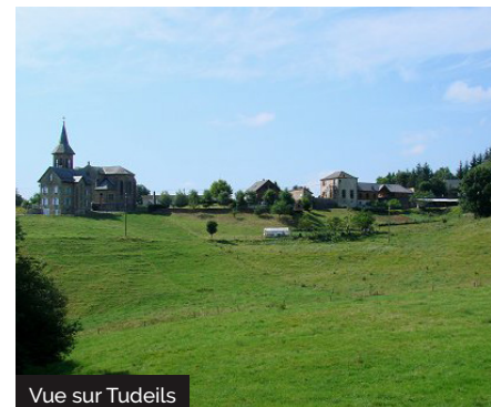
Vue sur Tudeils

L'église fut construite en 1876 à l'emplacement de la forteresse avec les pierres de celle-ci. L'église est en forme de croix latine, les murs sud et nord sont flanqués de chapelles ouvertes. A l'extérieur, au dessus de la porte, on voit une pierre sculptée, les clés de St-Pierre. Le retable (fin 17ème) est classé Monument Historique en 1974, oeuvre des Tournier de Gourdon. Au 17-18ème, il existe une technique de peinture des retables : «l'estofadora», la peinture est posée sur l'or puis grattée pour faire réapparaître l'or au sein de la surface peinte, un processus très onéreux. Il semblerait ici que le décor polychrome ne date pas de l'origine de celui-ci mais de celui de l'église (1876), il n'existe pas de couche de peinture plus ancienne dessous.