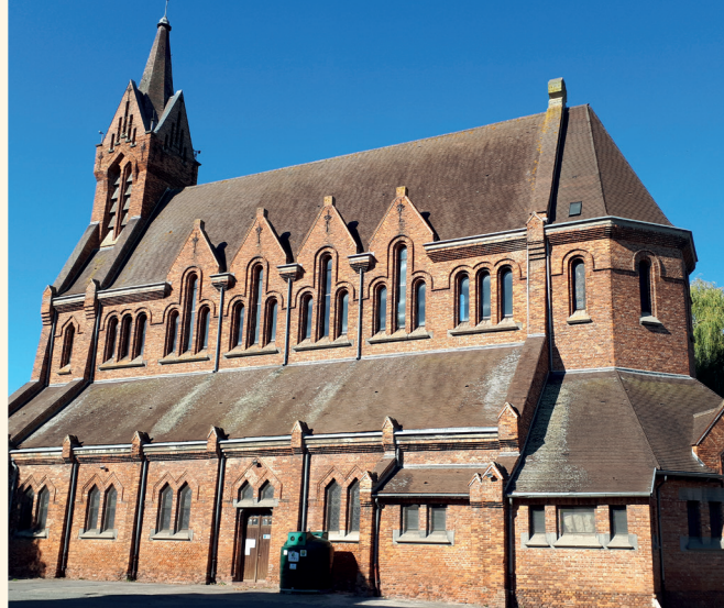
© Communauté d'Agglomération de Béthune-Bruay, Artois Lys Romane