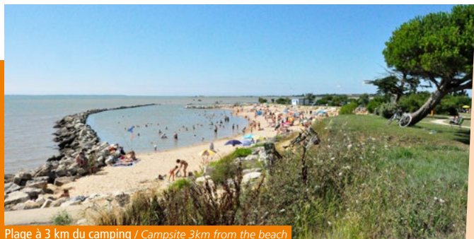
Plage à 3 km du camping / Campsite 3km from the beach

Quality is our first priority. We are a Qualité Tourisme site and have a mobile home adapted for reduced-mobility guests.