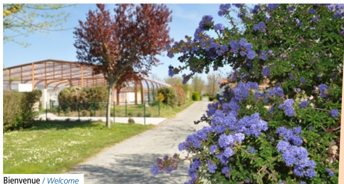
Bienvenue / Welcome

We are also ideally situated for exploring the rest of Charente Maritime, less than 45 minutes by car from all the major sights. Why not head out to one of its famed seaside resorts, for example: Châtelailion-Plage, Fouras or Royan?