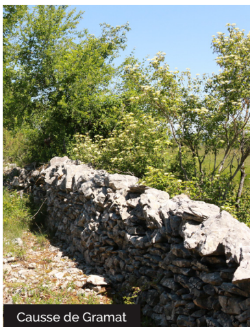
Causse de Gramat

Le 14 juillet 1944 eut lieu sur le plateau de Loubressac l'un des plus importants parachutages de la seconde guerre mondiale. Il permit la distribution de 110 tonnes d'armes aux Maquis du Lot. Pour la circonstance, 48 chars à boeufs, 38 camions et 1500 hommes furent nécessaires : environ 500 conteneurs avaient été largués.