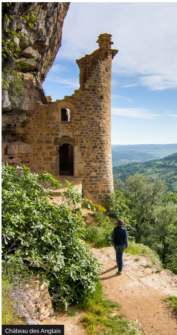
Château des Anglais

Deux des « Plus Beaux Villages de France » du Lot, Loubressac et Autoire sont distants de quelques kilomètres. Loubressac, construit sur une proue rocheuse qui domine, tel un belvédère, la Vallée de la Dordogne, se repère de très loin. Autoire se niche au pied des falaises calcaires du causse de Gramat profondément entaillé par le ruisseau d'Autoire qui surgit en cascade. Entre les deux se trouvent les ruines du château des Anglais. C'est en fait une « roque » c'est-à-dire une fortification devant une grotte naturelle. Ces roques furent souvent occupées par les troupes anglaises pendant la guerre de Cent ans. La Roque d'Autoire fut construite probablement à la fin du XIIIe siècle pour marquer les limites de la châtellenie de Saint-Céré et de la baronnie de Gramat.