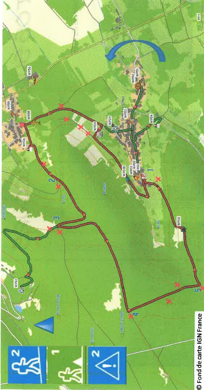
© Fond de carte IGN France

1-Départ au panneau R.I.S. (wp01), au bout de la rue. Sortir du village entre les maisons, de l'autre côté du de la fontaine du haut (wp02), direction les Côtes. Suivre le chemin herbeux qui fait vite un lacet, et revient derrière les jardins. A droite, voici l'observatoire astronomique (wp03b). Performant, il permet aux amateurs de passer la nuit à la belle étoile. Site calme et préservé, encore très naturel. Passer au dessus du cimetière allemand (wp04), oasis de verdure, dont le calme inspire davantage la paix que la guerre. Après le cimetière, tourner à droite et descendre jusqu'à une ancienne route en terre jaune. Tourner à gauche