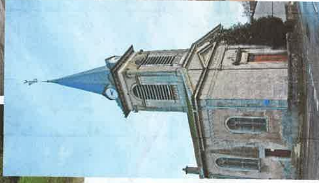
L'Eglise St Sébastien