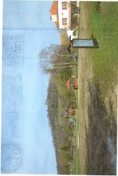
Panneau R.I.S au départ