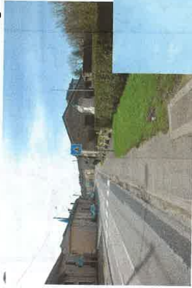
La traversée du village