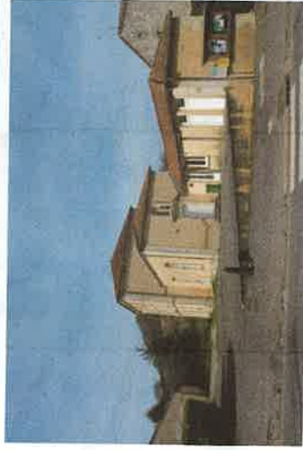
Les ex Ecole et Mairie