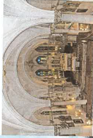
L'Eglise St Sébastien