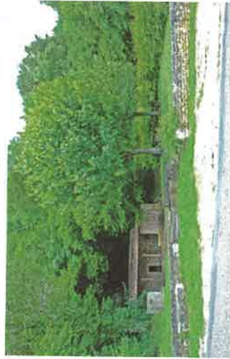
La Fontaine des Romains ...sur la route d'Hattonchâtel