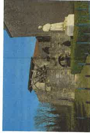
Maison de la Voûte