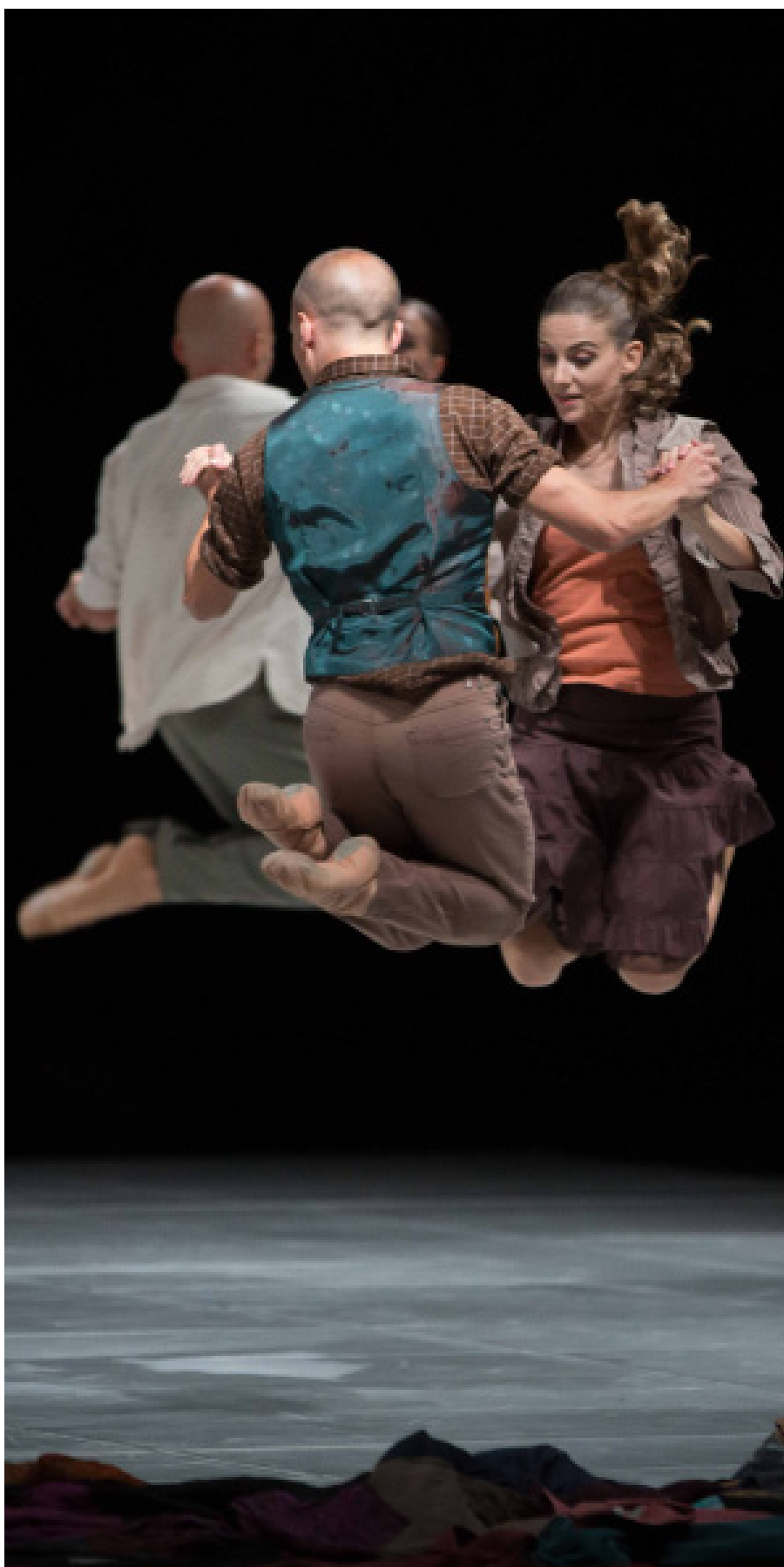
Une dernière chanson - Thierry Malandain