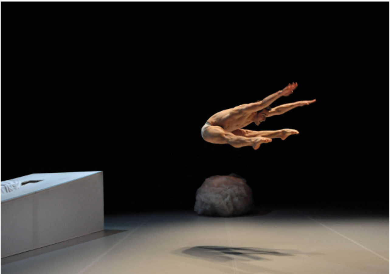
L'après-midi d'un faune - Thierry Malandain