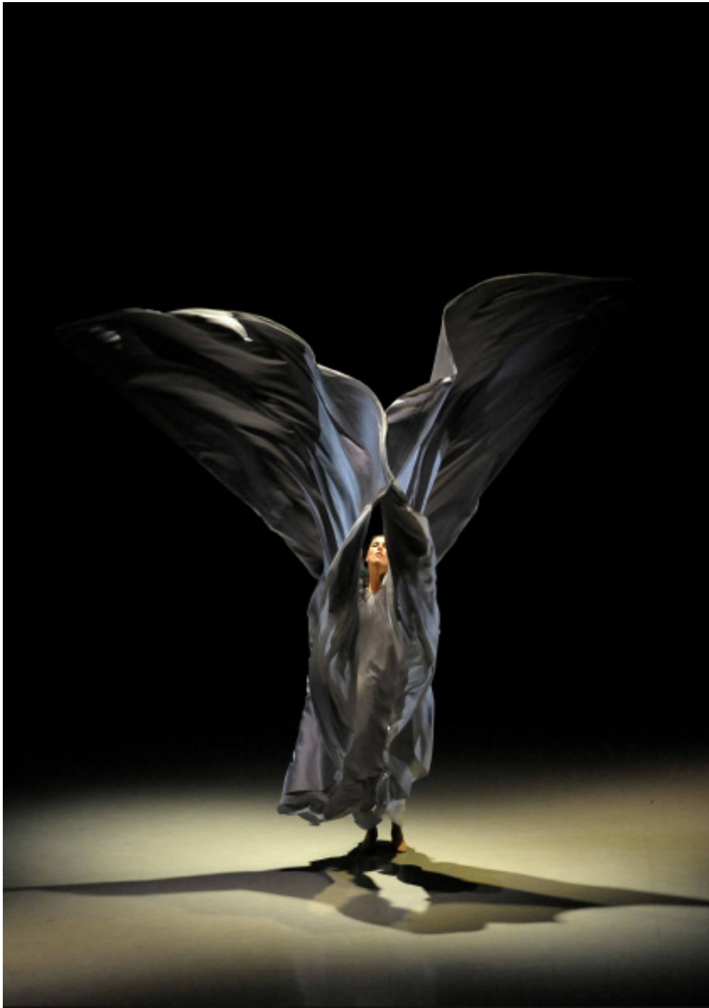
Les Créatures - Thierry Malandain

Cie Pepau - Pedro Pauwels 1, place du Coq 82000 Montauban