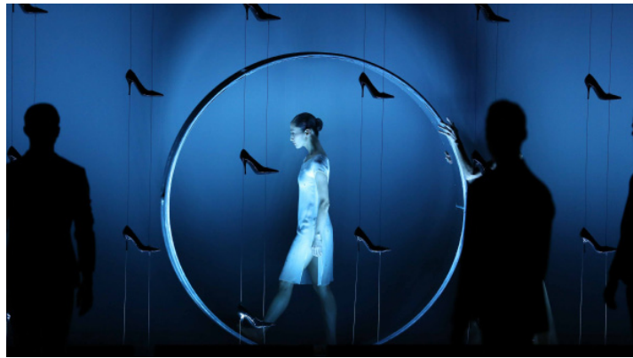
Cendrillon - Thierry Malandain ©Olivier Houeix