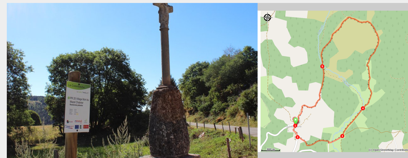
Départ du sentier à La Colombèche

Ce circuit se déroule sur les contreforts de la Margeride et vous emmènera au hameau du Mazel Chabrier.