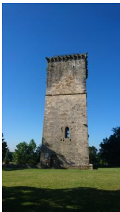
2 Tour de gué

A l'intérieur de l'église (ouverte tous les jours de 9h à 18h), l'autel en bois sculpté et peint du XVIe, ainsi que le rétable (MH) invitent à l'admiration. Tout autour vous pourrez apercevoir de nombreux terrains de chênes truffiers.