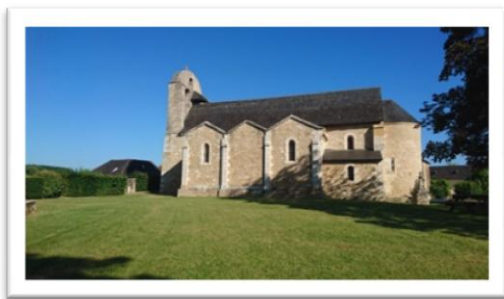
1 Eglise Saint Pantaléon