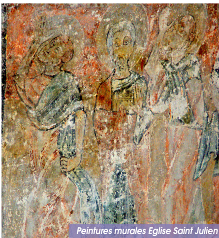
Peintures murales Eglise Saint Julien

Estavar regroupe les hameaux de Bajande, Caillastres et le mas Saint-joseph. La chapelle St Barthélemy de Bajande possède deux plats de quête du XVI e siècle.