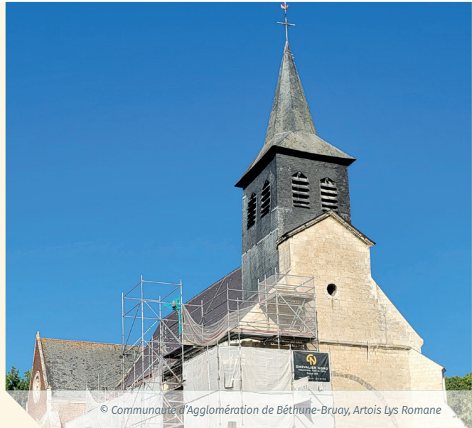
© Communauté d'Agglomération de Béthune-Bruay, Artois Lys Romane