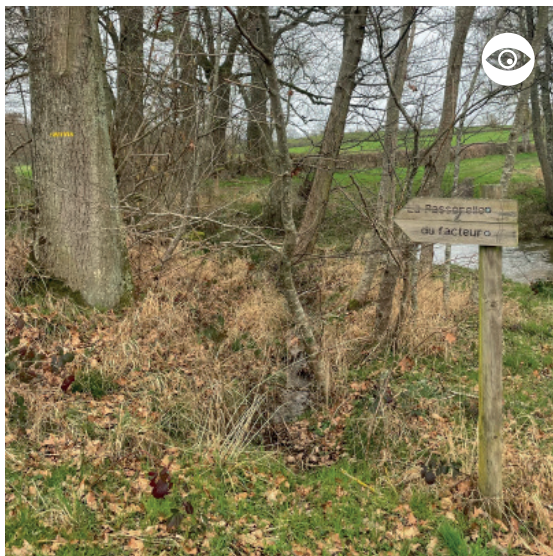
LA PASSERELLE DU FACTEUR