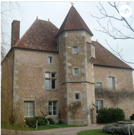
CHÂTEAU DES BUISSONS (PROPRIÉTÉ PRIVÉE)