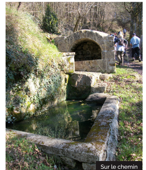
Sur le chemin

5 Au carrefour dans le village ( vue ), s'engager derrière le restaurant sur la petite route qui monte vers l'église de Puy-d'Arnac pour rejoindre le départ.