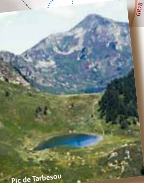
Pic de Tarbésou