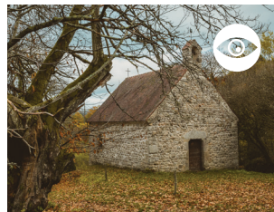
CHAPELLE DE MAISON DRU