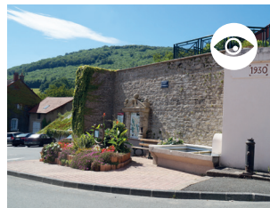
LAVOIR DU BOURG