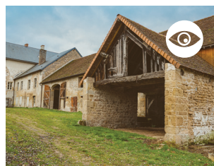
BÂTIMENTS DE L'USINE Ancienne usine de teinture.