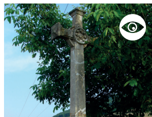
CROIX DE L'ÉGUILLY