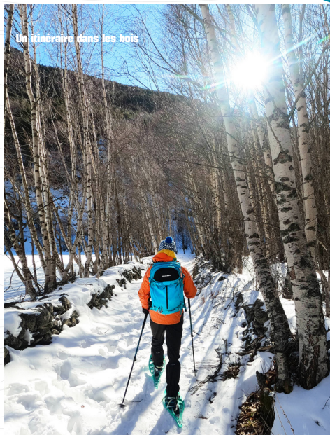
Un itinéraire dans les bois

Une nature omniprésente, des bâtisses en pierre typique blotties les unes contre les autres dans un dédale de ruelles, une église paroissiale du XVIIIème siècle, un espace de glisse étendu au pied du village... Porté-Puymorens est un petit village niché à 1600 m d'altitude à l'entrée du Parc Naturel Régional des Pyrénées Catalanes. Depuis le vallon de Font-Vive, on peut observer de nombreux mouflons, ainsi que des isards.