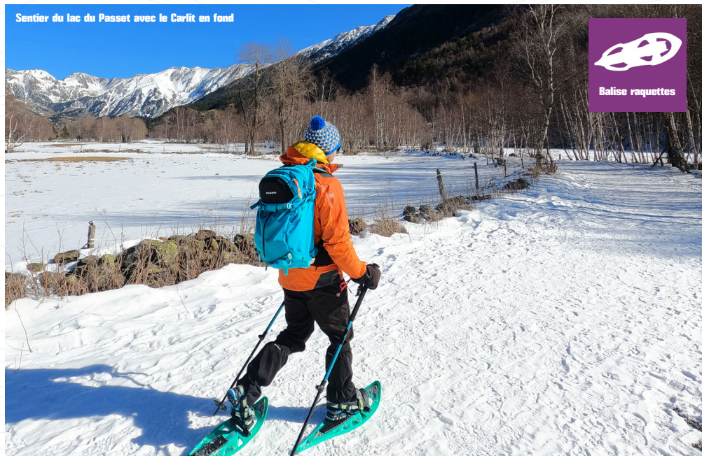
Sentier du lac du Passet avec le Carlit en fond