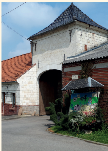
© Communauté d'Agglomération de Béthune-Bruay, Artois Lys Romane

Située à la sortie du village, l'ancienne ferme du château vaut le coup d'œil. Elle représente le dernier témoin d'envergure du château détruit vers 1800. Elle a été rachetée 100 ans plus tard par la Compagnie des mines de Bruay. C'est aujourd'hui une ferme où chacun peut faire des emplettes.