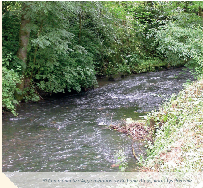
© Communauté d'Agglomération de Béthune-Bruay, Artois Lys Romane