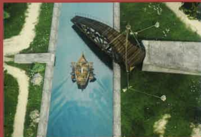
Animations 3D / 3D movies © 100 millions de pixels

Autoroute A10 (sortie n°18) et Autoroute A85 (sortie n°11). By Motorways A10 (exit n°18) and A85 (exit n°11)